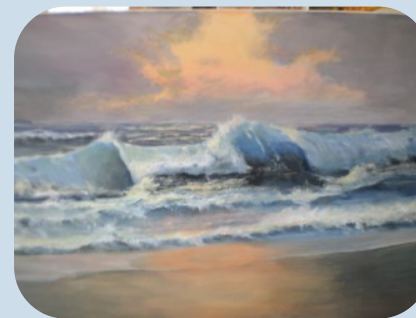
Morgen ved stranden